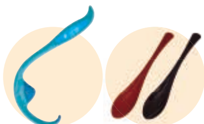
(A) ツボ押しグッズ (B) スプーンセット