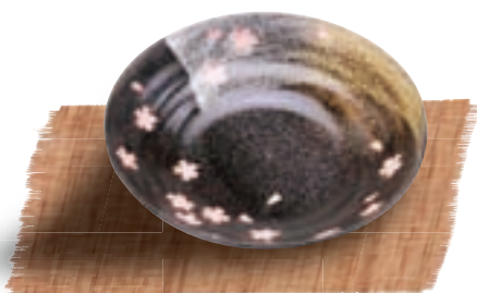
お誕生日プレゼント(平成25年度)