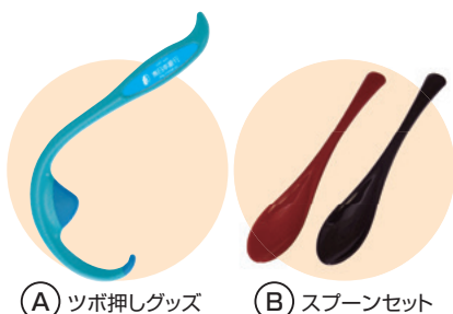
① ツボ押しグッズ ② スプーンセット