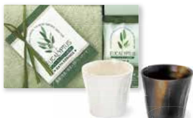
お誕生日プレゼント(平成26年度)